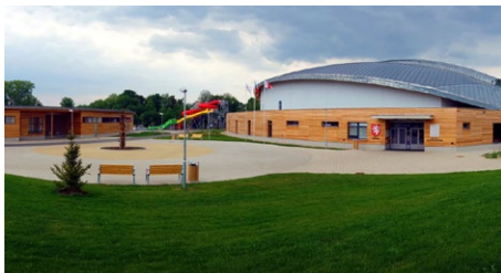
Absolutní prvenství v soutěži Stavba roku Libereckého kraje 2016 získal Sportovní a rekreační areál Maškova zahrada.

Titul Stavba roku Libereckého kraje 2016 letos putuje do Turnova. Absolutní prvenství v prestižní soutěži získal Sportovní a rekreační areál Maškova zahrada. Svým hlasováním se do výsledků zapojila opět i veřejnost.